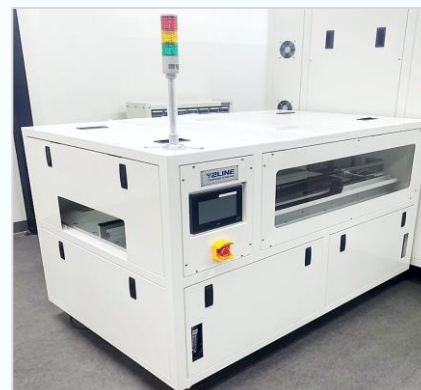
热板真空烘箱 (在线自动化型)