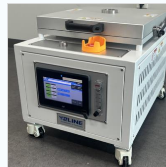
热板真空烘箱 (手动型)